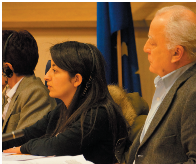
Dla Karimy Delli (Zieloni/WPE, Francja) inwestycje w mieszkalnictwo powinny być lepiej promowane w celu efektywniejszego zarządzania gospodarką i budżetem UE.

Według posłanki, inwestycje w mieszkalnictwo powinny być lepiej promowane i monitorowane w celu efektywniejszego zarządzania