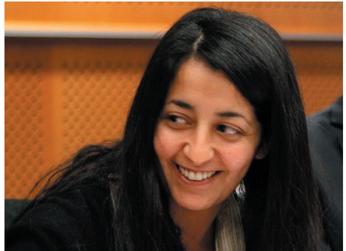
Karima Delli (Zieloni/WPE, Francja) jest autorką raportu Parlamentu Europejskiego dotyczącego mieszkalnictwa socjalnego w UE.

Jednocześnie podkreśliła, jak ważne było dla UE zdobycie własnych niezależnych danych