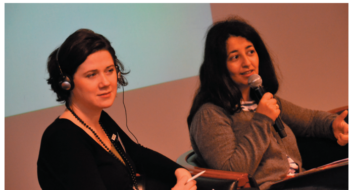
« La bataille du climat doit être menée avant tout par les villes », a déclaré la députée européenne Karima Delli (Verts/ALE, France) (à droite).

Les participants ont reconnu l'importance des feuilles de route énergétiques définies sur le long terme, qu'elles soient établies à l'échelon européen ou à l'échelon local, car elles servent de guide pour la prise de décision à court terme et pour assurer une utilisation durable de l'énergie dans les villes.