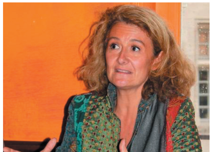
L'eurodéputée Sophie Auconie (PPE, France) veut améliorer l'information sur les Fonds structurels européens au niveau local et régional.

Pour Mme Auconie, « il y a un réel besoin de renforcer l'information des élus locaux et régionaux en charge de l'élaboration des politiques de développement territorial. Un tel programme pourrait améliorer considérablement leurs connaissances par la mise à disposition des instruments politiques clés et par le soutien apporté par leurs homologues ».