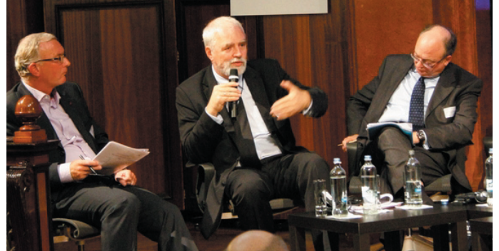
Les députés européens Jan Olbrycht (PPE, Pologne) (au milieu) et Malcolm Harbour (ECR, Royaume Uni) (à droite) ont participé à la conférence avec des architectes.

Malcolm Harbour, député européen (ECR, Royaume-Uni), Président de la Commission parlementaire du marché intérieur et de la protection