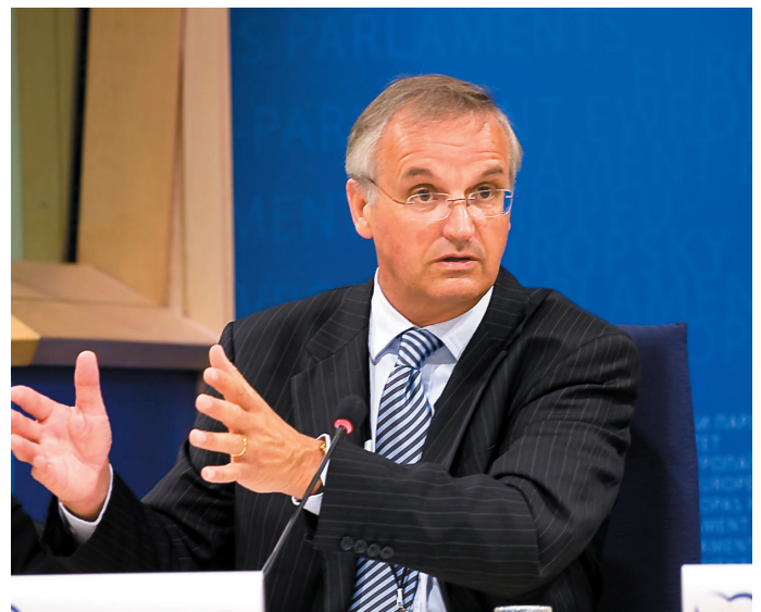
« Les villes devraient investir dans des projets plus écologiques, plus innovants et inclusifs », a dit le député européen Lambert van Nistelrooij (PPE, Pays-Bas) lors de l'assemblée générale de l'ENTP.

Ces nouveaux instruments financiers offrent de nouvelles possibilités via l'action de la Banque Centrale Européenne. Les représentants de la délégation ont visité plusieurs projets de développement de villes nouvelles à Eindhoven et Helmond, ainsi que dans la partie occidentale des Pays-Bas (Rand-