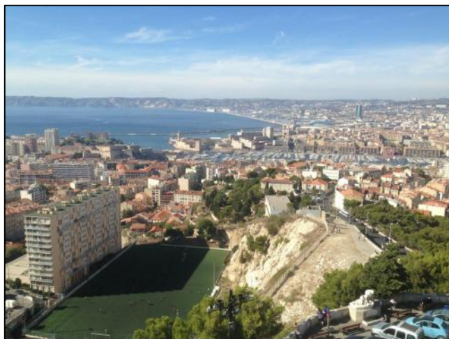
Vue sur le Vieux Port de Marseille