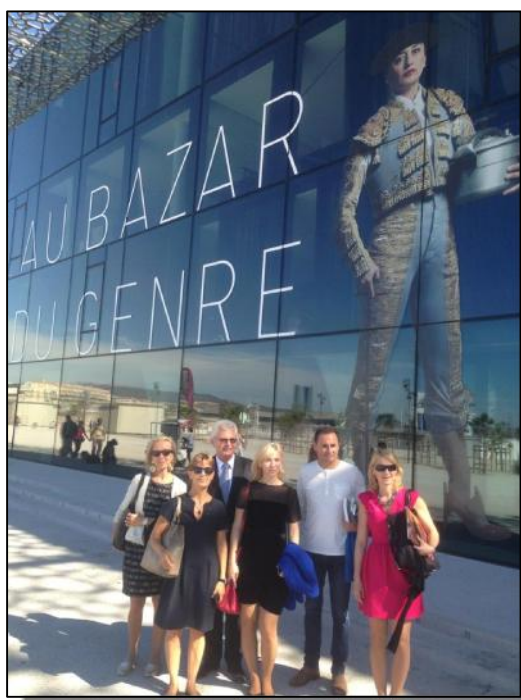
La délégation devant le MUSEM

Le MUSEM est un musée centré sur la méditerranée, son histoire et ses cultures, avec des expositions temporaires et des expositions permanentes. Sa construction a redessiné le front de mer de Marseille. Grâce à une passerelle sur le toit, il est relié au fort Saint-Jean (ancienne caserne militaire entièrement réaménagé) et au reste de la ville pour devenir un centre culturel multifonction qui revitalise les anciennes friches portuaires.